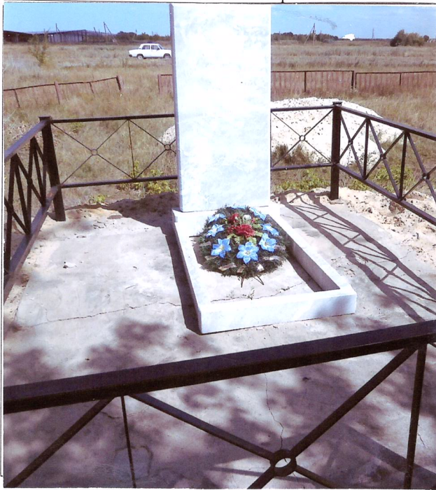
8. Фотоснимок захоронения.