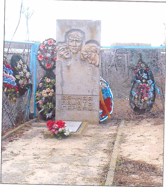
8 Фотоснимок захоронения