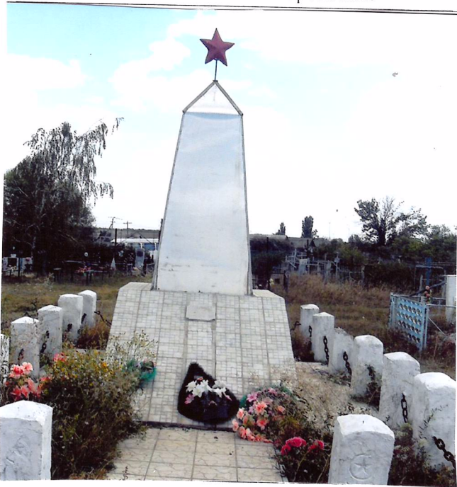
8. Фотоснимок захоронения.