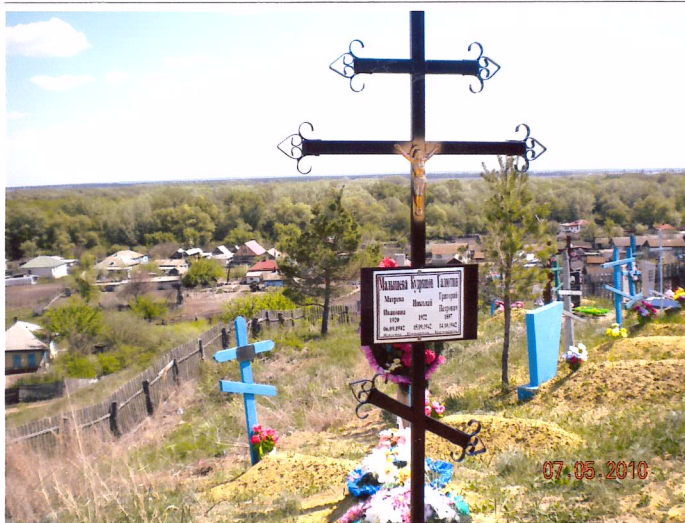
Братская могила умерших от ран в госпитале в хуторе Помалинском